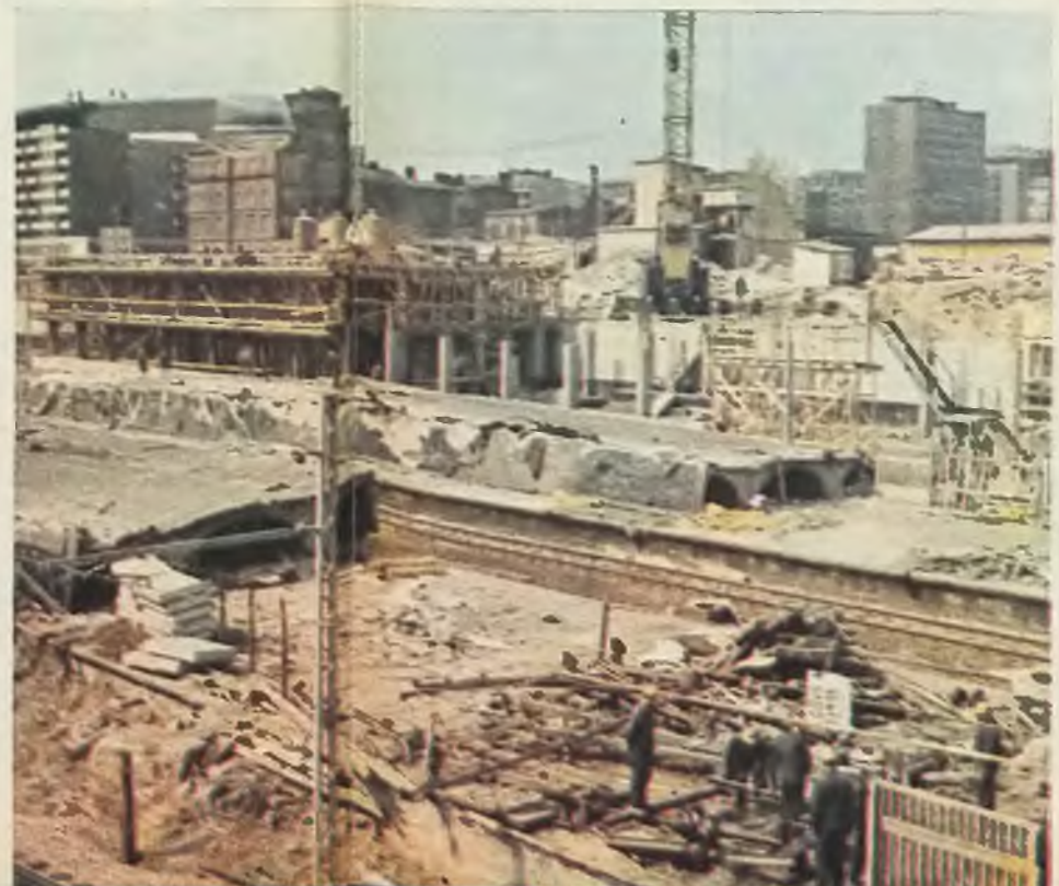
Rozbierane perony i wiaty starego dworca Warszawa Centralna widziane od ul. Emilii Plater

Nocą 4 kwietnia 1974 r. na budowie dworca Centralnego zakończono ostatni etap przelocowania ruchu kolejowego - poprzedniej, wieloletniej lokalizacji pod płytę nowo zbudowanego obiektu od strony Al. Jerozolimskich, zwanego blokiem południowym. Wczesnym rankiem 8 kwietnia, z drugiego z kolei peronu odjechały pierwsze pociągi, zdążające w kierunku zachodnim, inaugurując regularny ruch po nowych torach w obie strony. Oznaczało to kres życia starego prowizorycznego dworca „Warszawy Centralnej”; jego drewniane pawilony poszły pod kilof, ten sam los spotkał wiaty i stare perony, których wysadzenie przy użyciu materiałów wybuchowych, kruszących żelbetowe konstrukcje, przez szereg nocy nękało okolicznych mieszkańców.