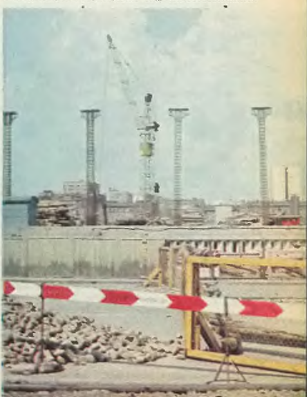
Pierwsze konstrukcje części naziemnej hali dworcowej, na pierwszym planie ciąg Al. Jerozolimskich

Prace zasadnicze skoncentrowały się na tzw. bloku północnym, tutaj stanąć ma ponad 1130 pali żelbetowych, na których oprze się konstrukcja płyty, mającej przykryć północną stronę wykopu. Podstawowe zadania tegoroczne obejmują wykonania przekrycia całej północnej części dworca, postawienie 24 słupów hali głównej oraz zmontowanie konstrukcji dachowej. Ponadto przewidziano dalsze znaczne zaawansowanie robót instalacyjnych, łączące z obiektami podziemnymi. (KK)