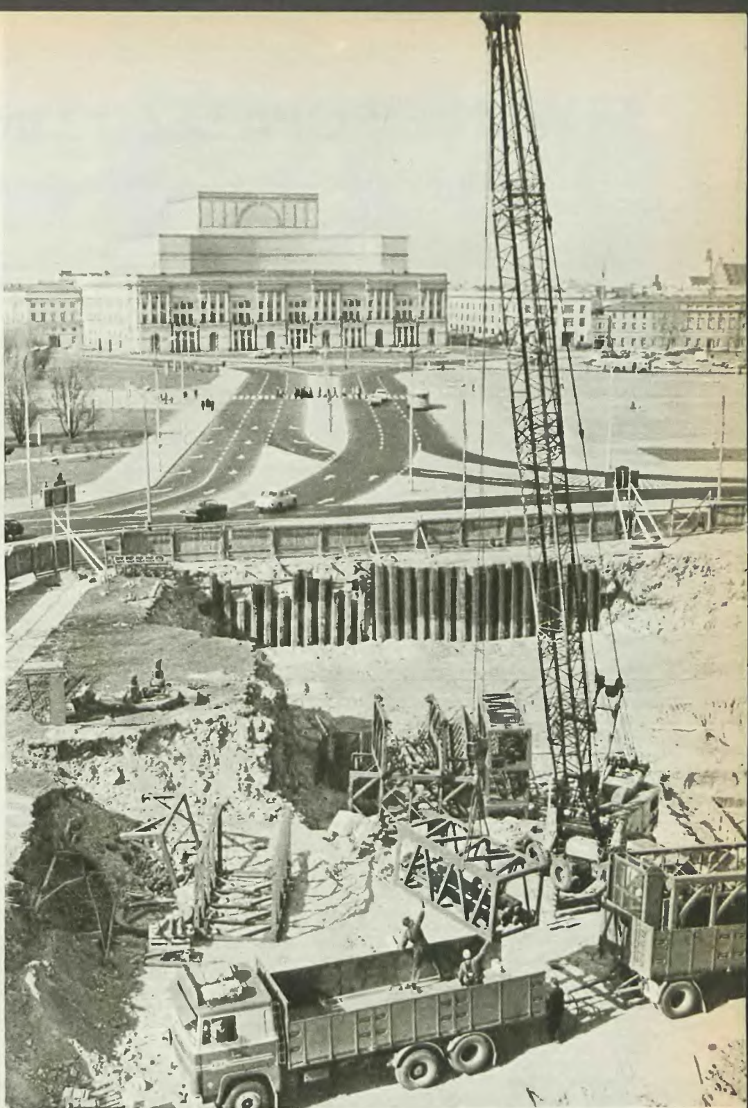
Widok na plac Zwycięstwa i teren robót z gmachu Ministerstwa Łączności