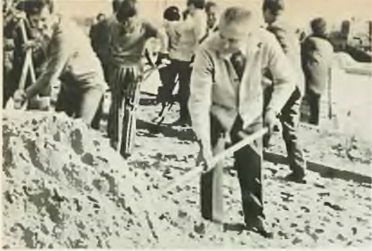
Edward Gierek przy pracy na Wistostradzie (Kępa Potocka)