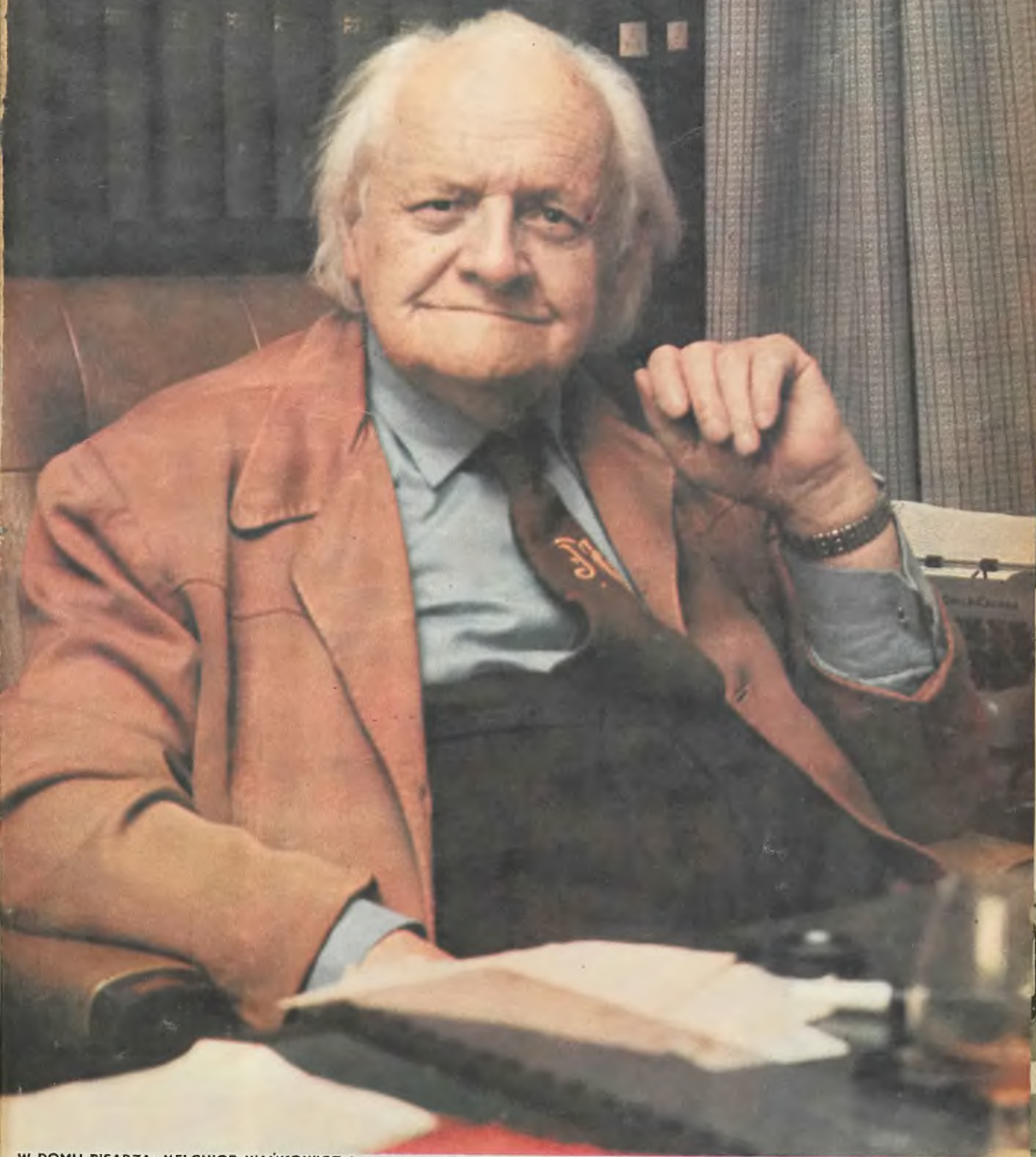
W DOMU PISARZA: MELCHIOR WAŃKOWICZ (patrz str. — 4-5)