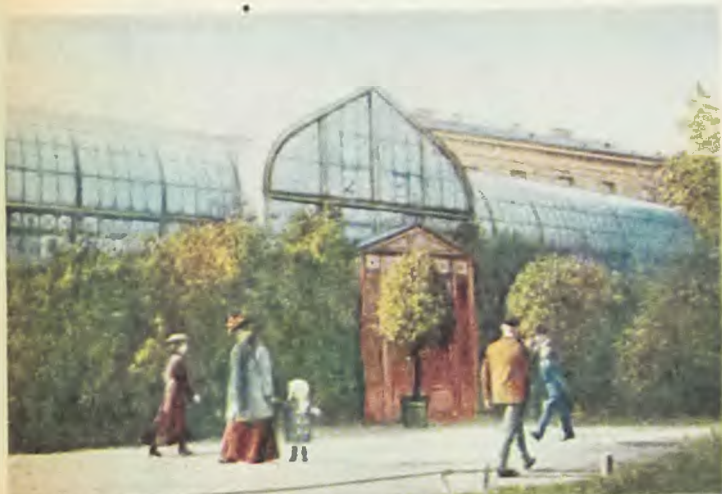
Oranżeria w Ogrodzie Saskim usunięta ostatecznie dopiero po wojnie, podczas przedłużania ulicy Marszałkowskiej.