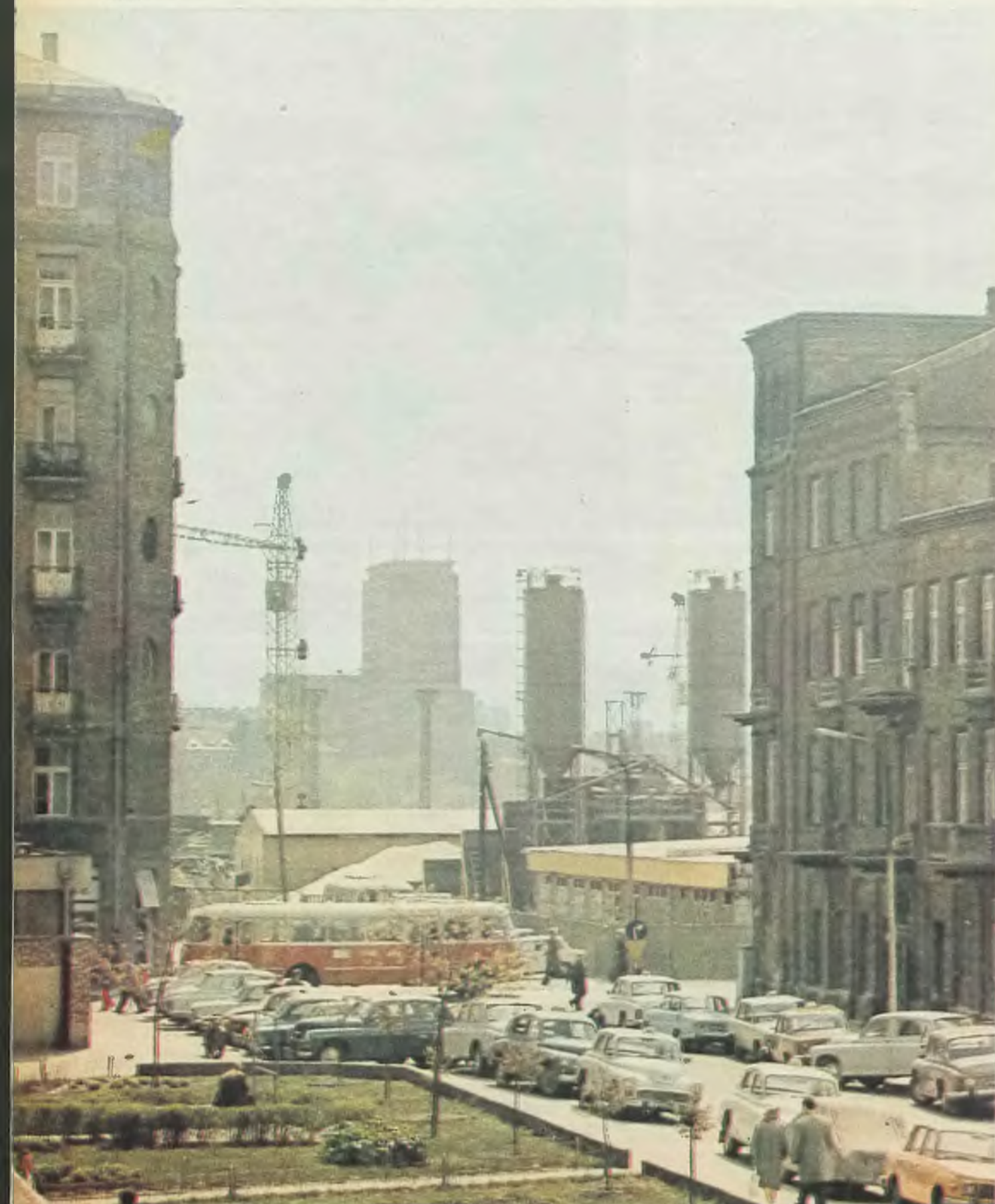
Widok z zaplecza osiedla mieszkaniowego Emilia na bazę i plac budowy nowego Dworca (w głębi)