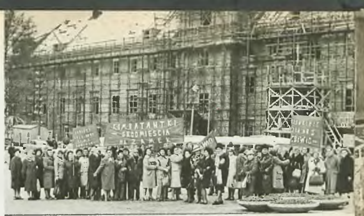
Członkinie Rady Kobiet — ZBoWiD Warszawa Śródmieście — dla uczczenia XXX-lecia PRL i V Kongresu ZBoWiD pracowały społecznie przy odbudowie Zamku w dniu 28 IV 1974 r.