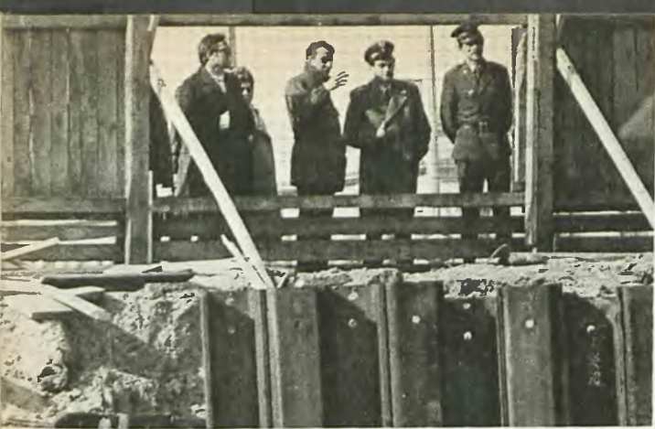
Plot, a co za plotem? — Każda budowa przyciąga wielu zainteresowanych, wzbudza dyskusje i komentarze