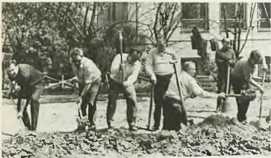
Prasa — na Trasie Łazienkowskiej (Saska Kępa)