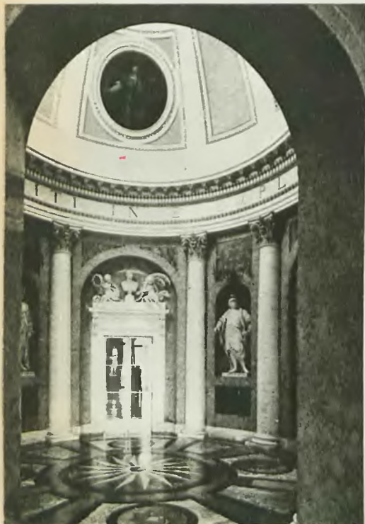
Rotunda w Pałacu Łazienkowskim